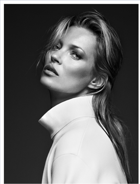
© BRYAN ADAMS, KATE MOSS, WHITE COAT, LONDON 2013