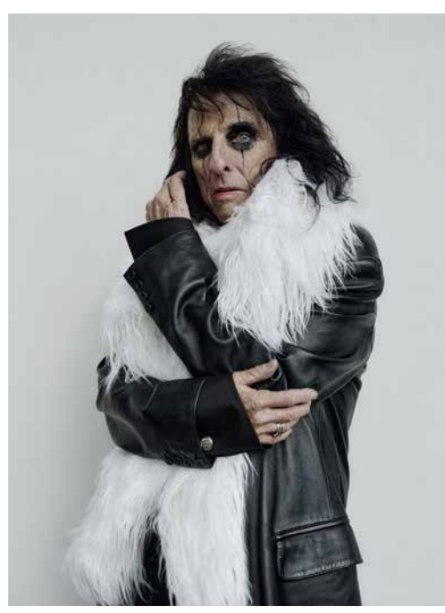
© BRYAN ADAMS, ALICE COOPER, FEATHER BOA, GERMANY 2024