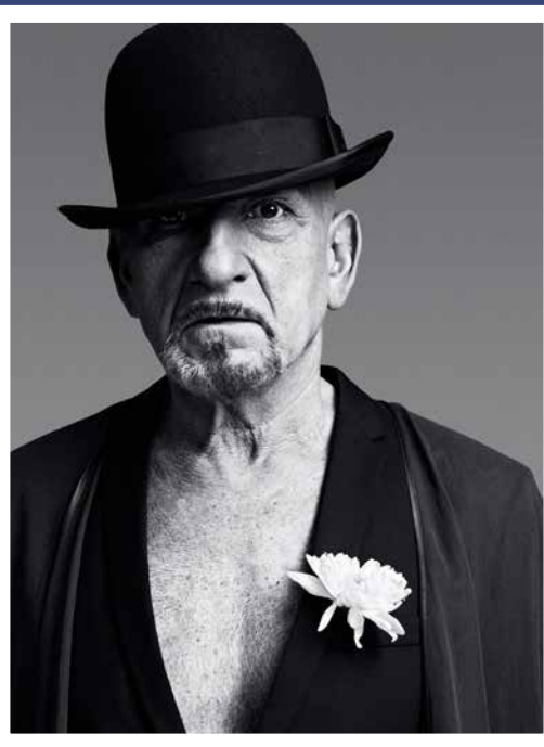
© BRYAN ADAMS, SIR BEN KINGSLEY, PORTRAIT WITH FLOWER, LONDON 2010

THAT`S WHY I LOVE PHOTOS: THEY CAPTURE A MEMORY. (BRYAN ADAMS, 2012)