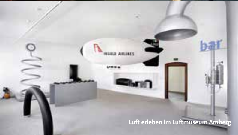
Luft erleben im Luftmuseum Amberg