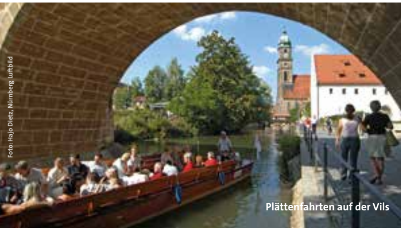
Plättenfahrten auf der Vils