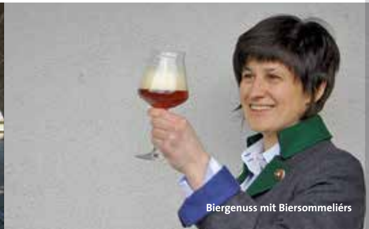
Biergenuss mit Biersommeliérs