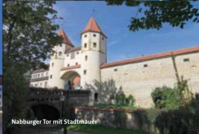
Nabburger Tor mit Stadtmauer

Die Stadt mit ca. 45.000 Einwohnern ist die gelebte Verbindung von Tradition und Fortschritt, bürgerlichem Lebensstil und Lifestyle, mittelalterlichem Charme und Moderne. Alt und Neu greifen wie selbstverständlich ineinander, die historische Altstadt mit Stadtmauer und einfühlsam sanierten Gebäuden beherbergt attraktive Einkaufsmöglichkeiten und ein modernes Dienstleistungszentrum.