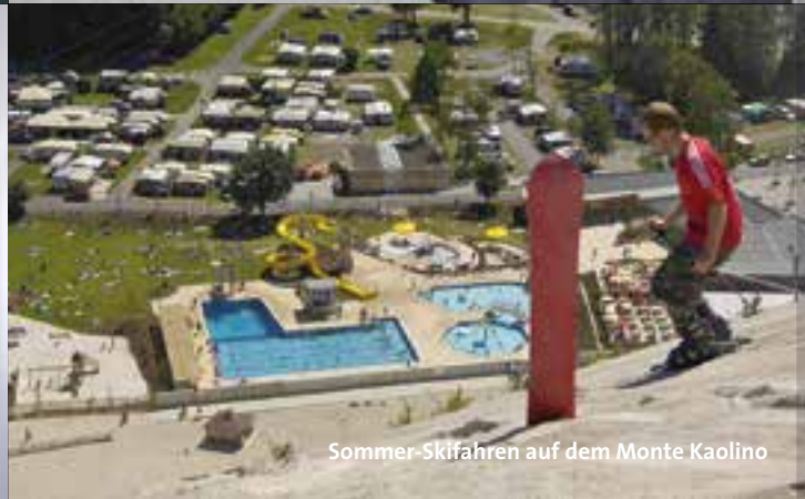
Sommer-Skifahren auf dem Monte Kaolino

Je nach Interessensgebiet stellen wir für Sie Ihr individuelles Rahmenprogramm zusammen. Egal ob für kleine oder große Gruppen, für einen oder mehrere Tage, Action, Wellness oder Kultur. Wir unterbreiten Ihnen einen Vorschlag und kümmern uns um die organisatorischen Details.